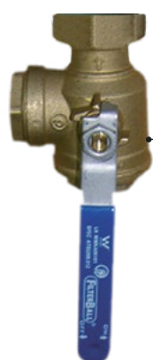
Kulový uzávěr 1" s filtrem